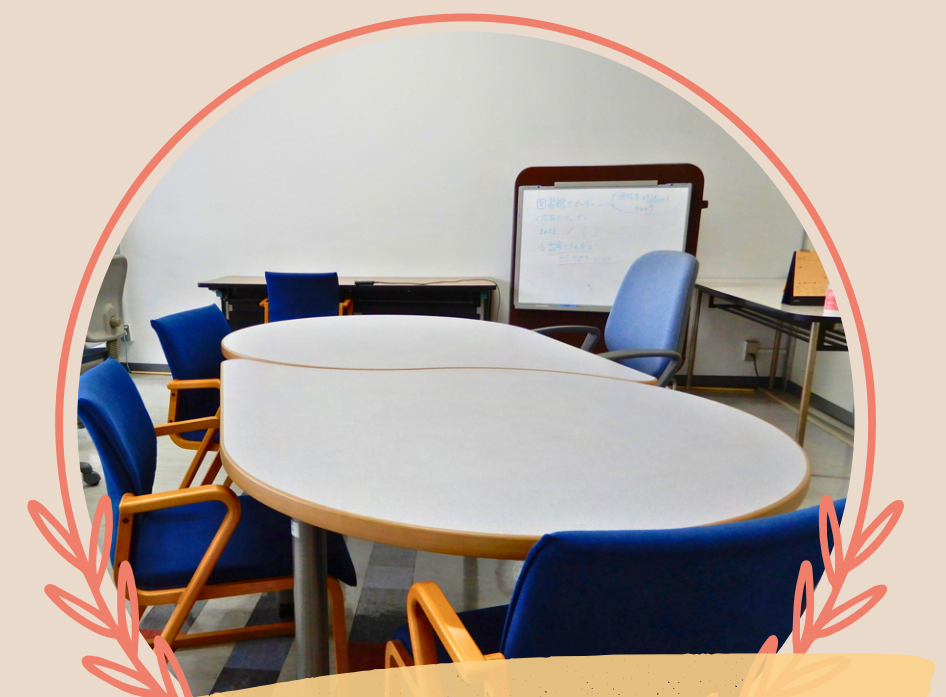
サポータールーム