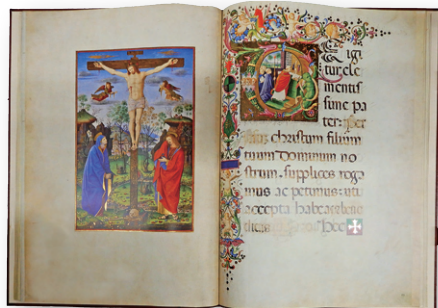
アレクサンデル六世クリスマスミサ典礼書 ファクシミリ版 岩波書店 Belsler Verlag [reproducer] 1987, c1986 (Borg. lat. 425) 第38葉裏、39葉表

本資料はヴァチカン図書館が所蔵するルネサンス期の写本の複製である。この写本はボルジア家の教皇のため1492年から95年に制作された。当時の教皇は年に3回、自らミサを司式し、そのうちクリスマスミサで使用するために制作されたのがこのミサ典礼書だ。ミサ典礼書とは、司祭のためミサの進行に関わる指示や朗読テキストなどが記された写本だが、写本所有者の権威が視覚的に伝わるよう、豪華に装飾されることがあった。この写本は特別に豪華で、煌びやかな装飾文字と教皇の肖像画が描かれた第8葉裏、《磔刑図》が画面いっぱいに描かれた第38葉裏などは、独立した絵画作品としての芸術性と魅力を持つ。現在でもこの写本は特別視され、2000年の聖年を目前にしたクリスマスには、実際にミサで利用され、その模様は中継された。