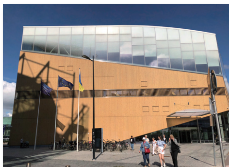
Oodi Helsinki Central Library

さて、学内の私の心休まる場所の一つに図書館地下の書庫がある。調べものをするために少しひんやりと感じる書庫に入り、知の宝庫である書物に囲まれながら深呼吸して静かなひとときを楽しむ。筆者は学生時代から、恩師が自主サークルとして開催してくれた「読書会」に参加し、毎月1冊本を読み、参加者と感想などを意見交換することを、現在も続けている。その面白さを学生の皆さんにも引き継ぎたいと学部ゼミでも行っている。学部卒業後数年を経て入学した筆者自身の大学院生時代には研究テーマに関わる UMI Dissertation を図書館に申請し、利用したことなどを懐かしく思い出す。中でも、女性文庫（1962年創設）は特によく閲覧する本学図書館の特徴の一つのコレクションであるし、関連して「ゲリッチェン女性史コレクション」(The Gerritsen Collection of Women's History, 1543-1945) を利用した研究を、現在筆者が所員として関わっている女性文化研究所の研究として、助手、大学院生、日本学術振興会特別研究員 (PD) 時代から傍らで見聞きしてきた。2023年夏にはその女性文化研究所のリサーチ・プロジェクトの一環として、フィンランド・ヘルシンキの Oodi Helsinki Central Library を訪問した。多くの市民がそれぞれの目的で自由に利用し、創造性を発揮できる様子を見て、生涯にわたる、まさにリスキリング・リカレント教育に図書館が果たす役割についても思いを馳せることができた。多くの大学院生・学部学生が、価値共創を拓く場として図書館を活用しながら研究を進めていくことを期待している。