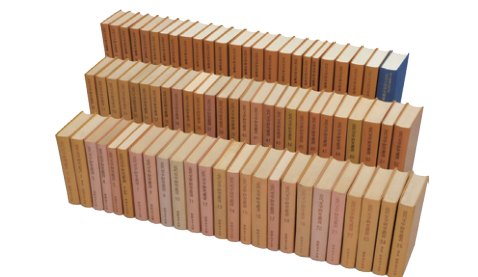
上：第1回生遠足 (大正14年10月22日 中央が創立者) 下：近代文学研究叢書76冊、別巻 昭和31 (1956) 年1月—平成12 (2000) 年10月