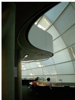
Berlin Free University (図書館)

これに絡んでもう一つ授業ネタがあるが、またの機会に、あるいは、授業を受講する方にお伝えできればと思う。すでに聞いたはずの方は、初めて聞いたとは言わないで欲しい。毎年話しているはずなので。