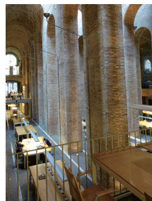
Universitat Pompeu Fabra (図書館)