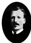
+ 0 ↓ Select ID: TAD1744647 Theodore Van Gogh aka Theo (1857-1891), c.1885 (b/w photo)