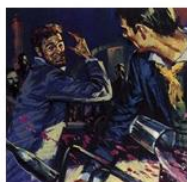
+ 0 ↓ Select ID: LAL957291 Vincent Van Gogh and Paul Gauguin were friends but drink led to arguments (colour litho) English School, (20th century)