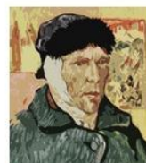
+ 0 ↓ Select ID: LAL2816732 Vincent Van Gogh, with bandaged ear (colour litho) English School, (20th century)