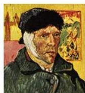
+ 0 ↓ Select ID: LAL319702 Van Gogh with a bandage round his head (redrawn) English School, (20th century)