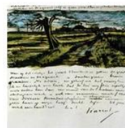
+ 0 ↓ Select ID: XRD1730774 Letter 252 from Vincent van Gogh to Theo van Gogh: Pollard Willow, c.1st August 1882 (pen & ink and w/c on paper) Gogh, Vincent van (1853-90)