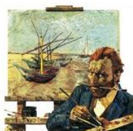
+ 0 ↓ Select ID: LAL337972 Vincent van Gogh English School, (20th century)

使いやすいリサーチ機能と詳細検索、画像の縮小拡大、スライドショー機能など、多数の画像へ簡単にアクセスできます。インターネット上の情報とは異なり、画像や作品情報は所蔵先の情報であるため正確です。